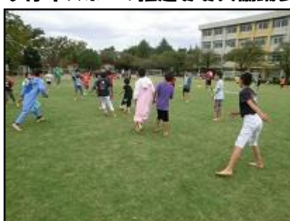
鶴牧サッカークラブ