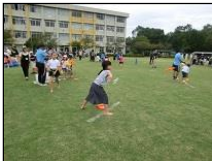
多摩市スポーツ推進委委員協議会