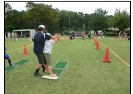
少年野球チーム「多摩ボーイズ」