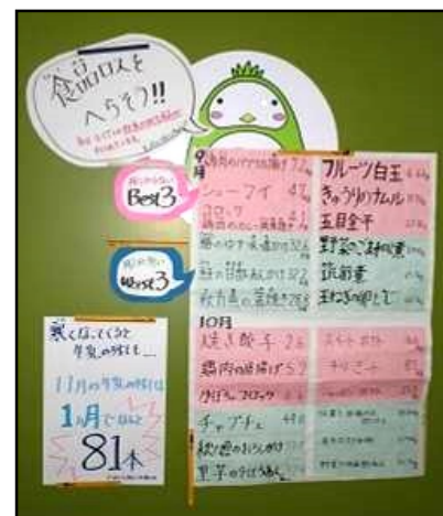
給食委員会による 食品ロスを減らす取組

最近、学校でのケガでも骨折が30年前に比べて9倍に増えているという事実があります。丈夫な骨をつくるにはカルシウムが欠かせません。牛乳、ほうれん草、ワカメや煮干しなど日々の食材にも気を遣いたいものです。インスタント食品やファーストフードの浸透で日本の風土にあった食の体系が崩れているとも言われています。とにかくカルシウム不足は精神が不安定になる、落ち着きがなくなる、気性が荒くなるなどの影響があります。カルシウムが神経系統を正常に作用させる栄養素であることを再確認して、日々の食生活をも見直していきたいものです。また、学校の給食は栄養のバランスに配慮しており、給食委員会の児童が、全校児童に給食をしっかりと食べて食品ロスを減らすよう呼びかけています。「健康な精神は、健康な体に宿る」という格言のように、学校でも日頃から体を鍛えて、健康な心、精神を安定させるような生活習慣を心がけるよう指導いたします。ご家庭でもご協力をお願いします。