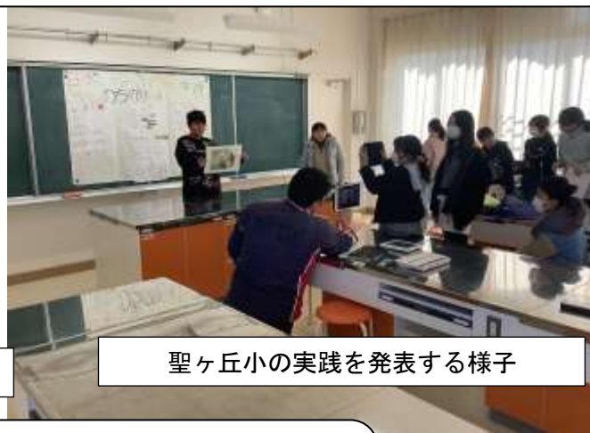
聖ヶ丘小の実践を発表する様子

多摩市内でお米を栽培している4校（聖ヶ丘、瓜生、永山、貝取、）で交流会を行いました。オンラインでの交流で接続等上手くいくか心配でしたが、それぞれの実践を発表し、互いに質問し合うなど交流をすることができました。