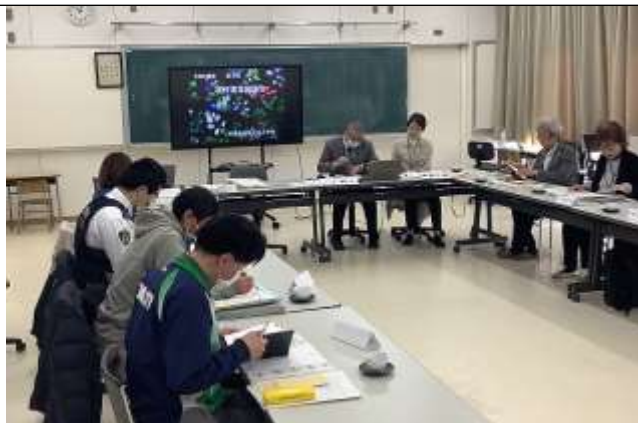
校長より1年間の教育活動を報告する様子

学校運営協議会を行いました。今回は、1年間の教育活動の報告と評価、来年度の経営方針についての説明を行いました。委員の皆さんからは、地域と子供たちのつながりを今後も大切にしていきたいというありがたいお言葉もありました。