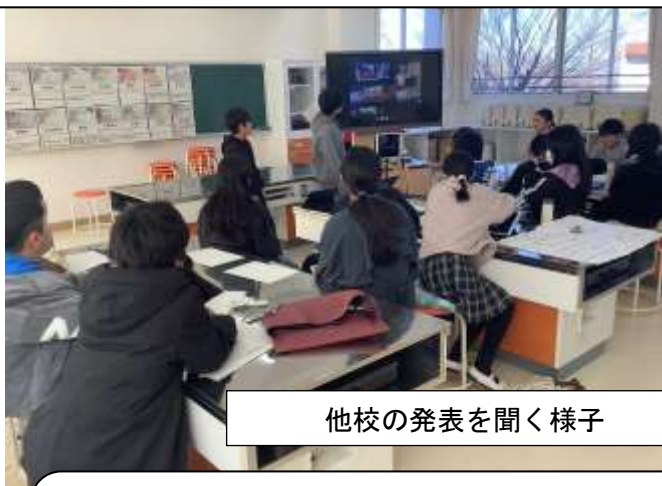
他校の発表を聞く様子