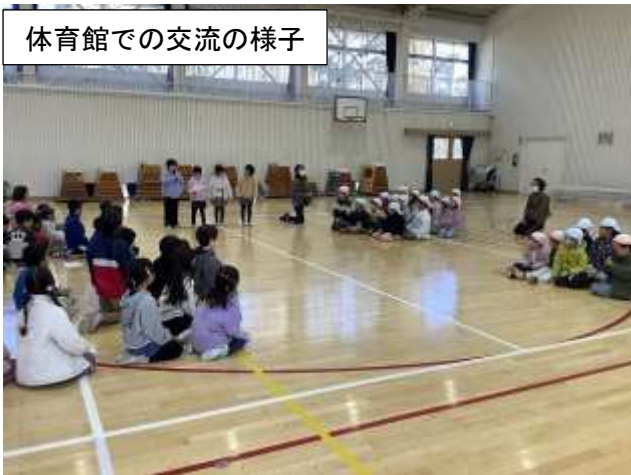
体育館での交流の様子