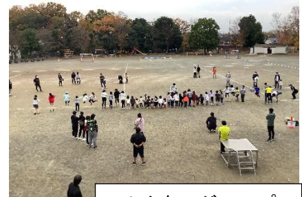
みんなでジャンプ