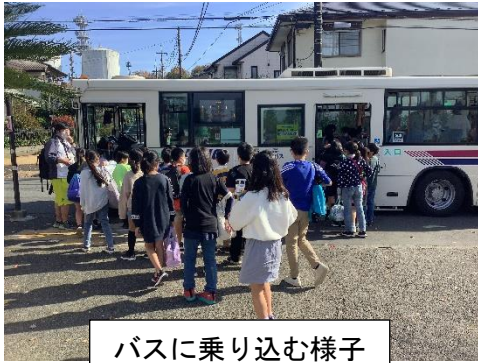
バスに乗り込む様子