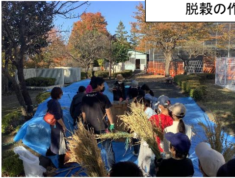
脱穀の作業の様子