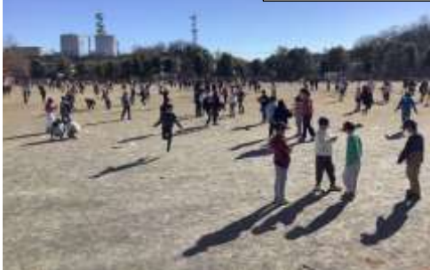
短なわに取り組む様子