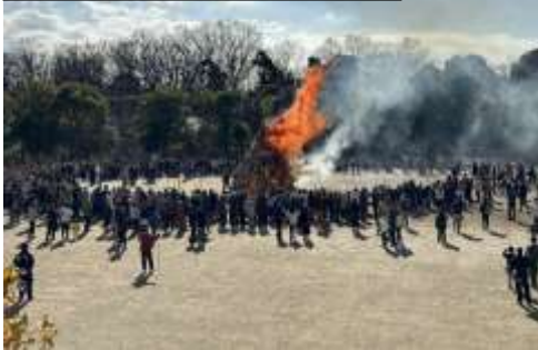
どんど焼きの様子