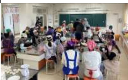
おにぎりパーティーの様子