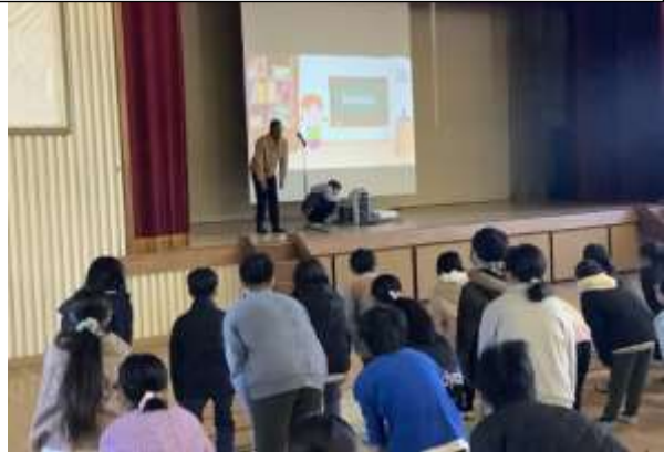
音楽朝会で英語の歌と一緒に歌う様子