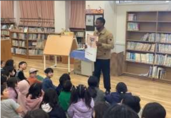
英語の絵本を読み聞かせをしている様子