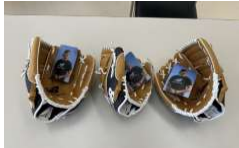
大谷翔平選手から寄贈されたグローブ