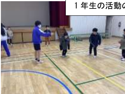
1年生の活動の支援をする様子