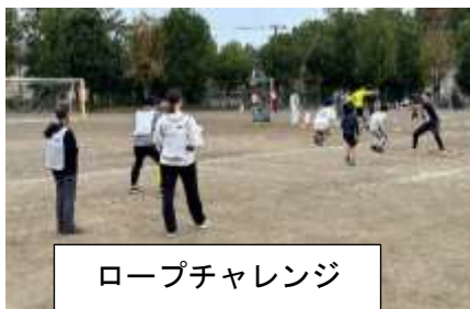
ロープチャレンジ