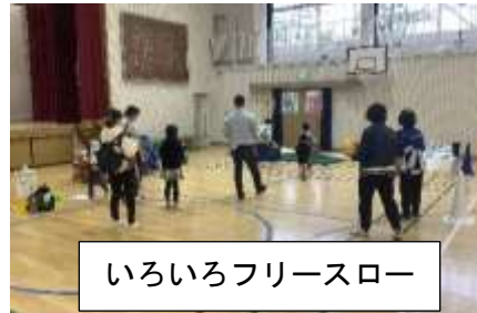
いろいろフリースロー