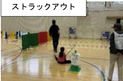
ストラックアウト