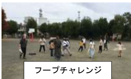
フープチャレンジ