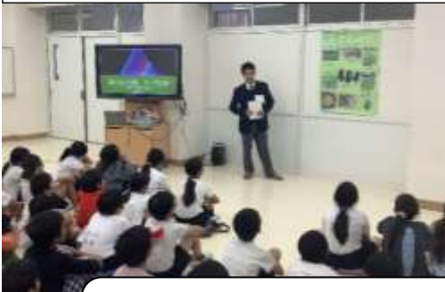
多摩大聖ヶ丘高校2年生による地域の環境美化に関する授業