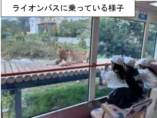
ライオンバスに乗っている様子