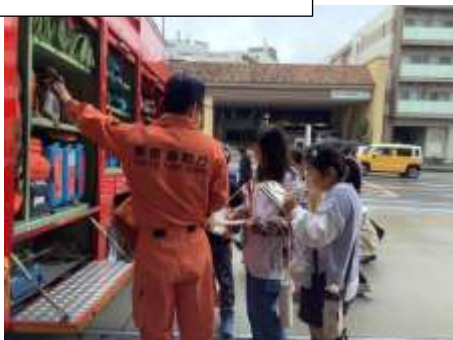
消防車の装備の説明