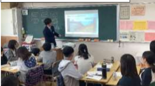
多摩大聖ヶ丘高校2年生による地域防災に関する授業の様子