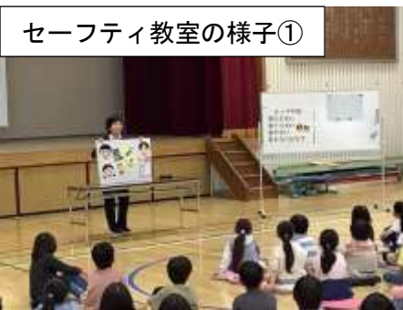
セーフティ教室の様子①