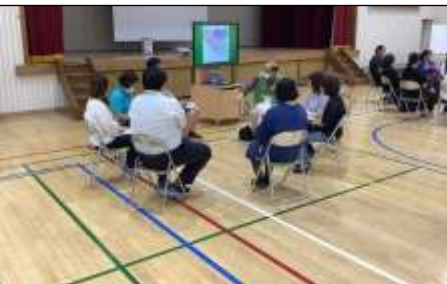
地域の方や保護者の方との交流会

セーフティ教室終了後は、地域の方や保護者の方と一緒に、聖ヶ丘小周辺の交通安全面で危険な箇所を出し合いました。この意見を通学路安全点検で警察の方や市役所の方と協議して看板設置や歩道の修復などの要望を出していきます。