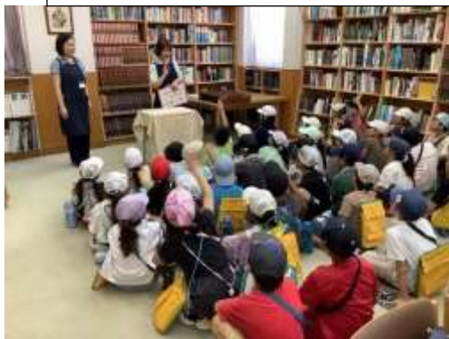
図書館の使い方を教えてもらっている様子