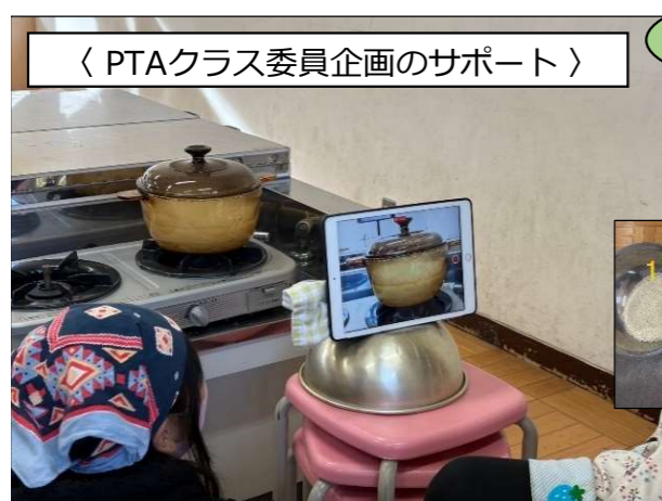
▲タブレットでタイマー&作業記録