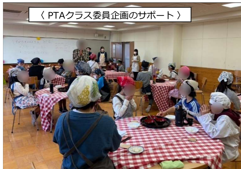
〈 PTAクラス委員企画のサポート 〉