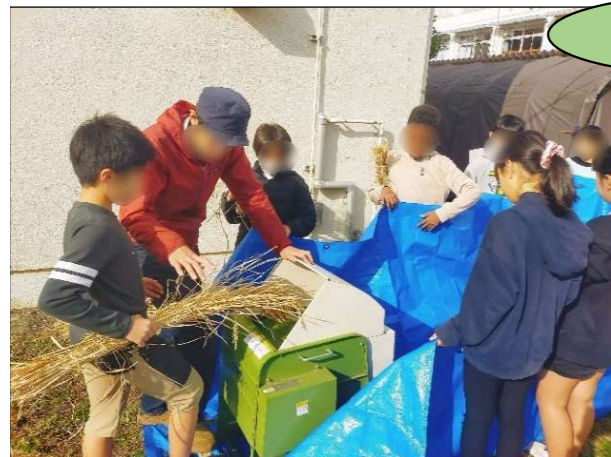
▲講師を招いての授業

「ライスプロジェクト」 前期授業 田起こし→代かき→田植え→（草とり）→稲刈り→はざがけ