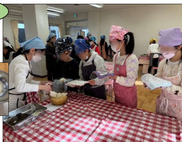
▲愛和米と2種の米の食べ比べ