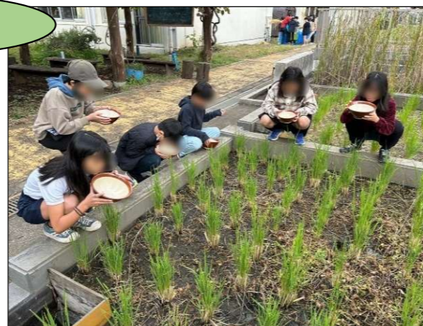
▲もみを吹いてとばす