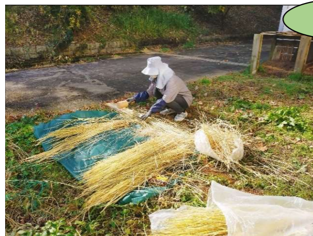
▲事前準備：藁を小槌で叩いて柔らかく