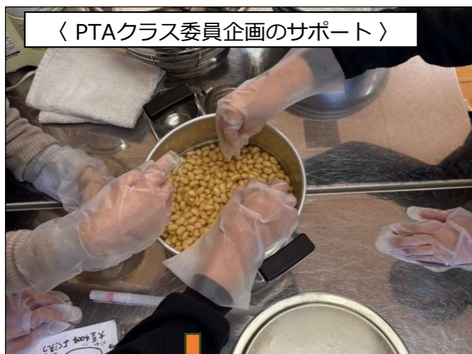
〈 PTAクラス委員企画のサポート 〉