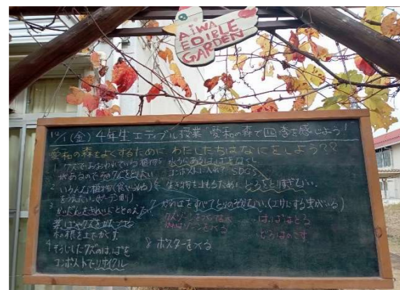
【4年】〈循環〉第2回 愛和の ガーデンにある循環を体験しよう