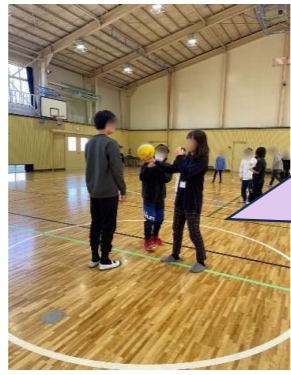
【学習サポーター】3小（愛和小・二小・東寺方小）交流 ドッジボール大会 in 和田中学校体育館

2小交流（愛和小・三小）は東 愛宕中でスタートする 「愛宕Spece」立ち上げ のため、開催を見合わせま した