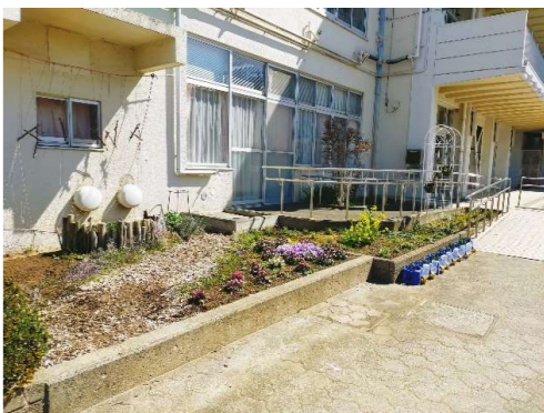
3月〈花壇のお手入れ〉