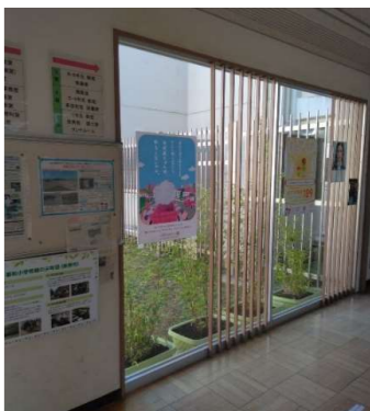
12月〈花壇のお手入れ〉

正面花壇 ひまわり種まき セネッティ片付け 中庭からネモフィラ ポピー、ナデシコの 移植 中庭 キキョウ鉢植え