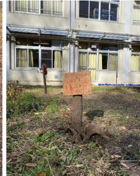
【4年】〈循環〉第3回 自分たちに何が出来るか考えよう