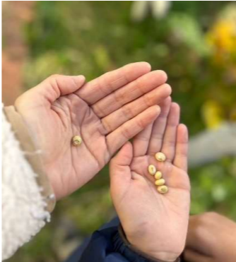
【3年】〈すがたをかえる大豆〉 豆腐作り