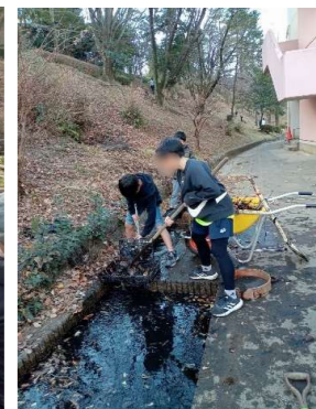
【4年】〈循環〉第4回 実践しよう