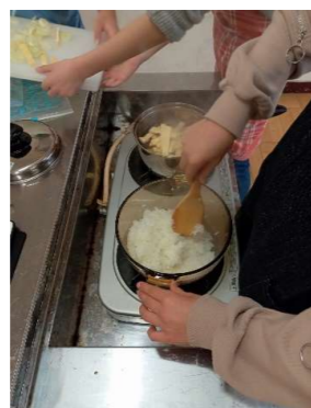
【5年】〈ライスプロジェクト〉 炊飯