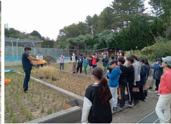
【5年】〈ライスプロジェクト〉 脱穀・もみ摺り