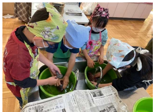
【2年】さつまいもの調理