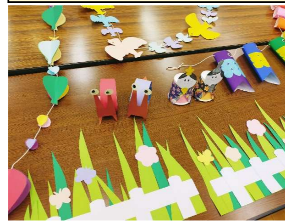
【図書サポーター】第3回 掲示物作成〈春〉