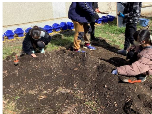
【5年】じゃがいもを植えよう 6年生で引き続き学習します