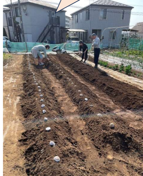
地域の畑 じゃがいもの植え付け