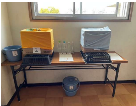
【4年】〈循環〉第5回 コンポストを作ろう 5年生で学習する田んぼの肥料にします