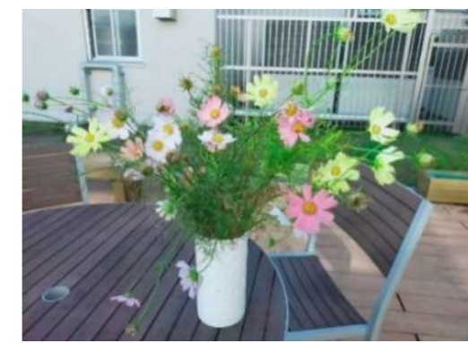
11月〈花壇のお手入れ〉校内美化委員さんと一緒に作業

集めたコスモスは 校長室の前に飾り 付け まだ気温が高く マリーゴールド ジニアが元気に咲 いていました