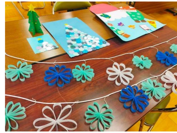
【図書サポーター】第2回 掲示物作成〈冬〉

2小交流（愛和小・三小）は東 愛宕中でスタートする 「愛宕Spece」立ち上げ のため、開催を見合わせま した