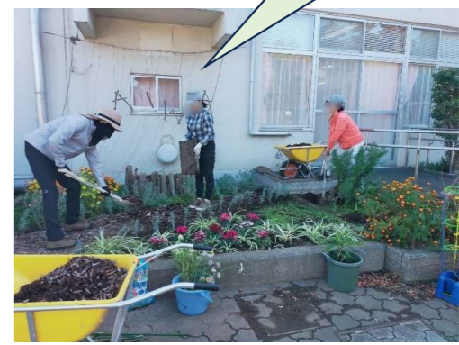
11月〈花壇のお手入れ〉

正面花壇 パンジーなど 菜園サポーター 宅で育てた苗と 木もれ陽さんで 購入した苗を植 えました