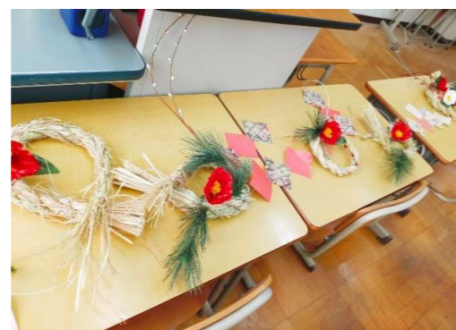
【5年】〈ライスプロジェクト〉 しめ縄作り 飾りはPTAのクラス費から提供