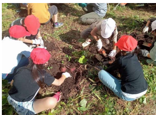
【2年】さつまいもの収穫