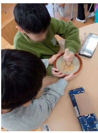
【3年】〈すがたをかえる大豆〉 きなこ作り