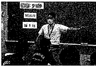
ツアーコンダクター