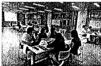
【④小中合同学力向上研修】