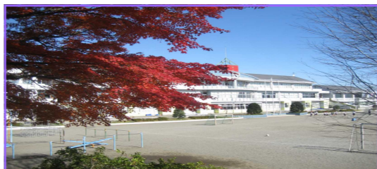
高根沢町立西小学校

～ 保護者や地域の人たちが、学校の教育活動の計画や実践に 参画・参加する開かれた学校を目指して ～