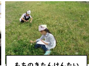
もちのきたんけんたい