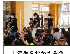
1年生をむかえる会