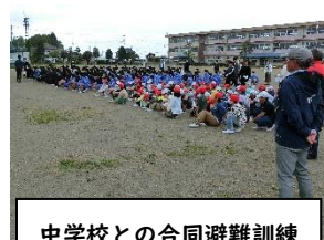
中学校との合同避難訓練