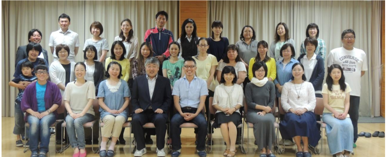
第1回PTA理事会 ～まずは、私たちから笑顔でスタート！～

5月28日(木)、午後7時から開催しました。どうしても御都合が悪く欠席の方もいらっしゃいましたが、ほぼ全員の方が出席してくださいました。ありがとうございます。年4回の理事会が行われますが、和気あいの雰囲気、楽しんでやっていきましょう。