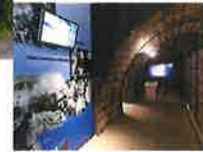
黒部川電気記念館