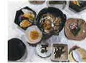
将棋村天童タワー（昼食）

山形県民の団らんに欠かせない「芋煮」をいただいた。地域により異なるが今回は牛肉を使用した芋煮が提供された。