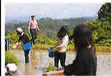
十日町市、民泊 体験説明会