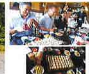
由屋のへぎそば（昼食）

つなぎに布海苔を使った そば。新潟の郷土料理。 ツルツルとした食感と弾 力あるコシがある。薬味 はからしが付くのも特徴。