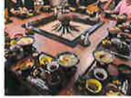
庄内観光物産館（昼食）

越後の大地主の大邸宅を公開。8,800坪に及ぶ広大な敷地には、高名な庭匠による庭園がある。四季折々の風情が楽しめる場所。