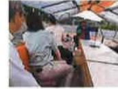
最上川ライン下り

雄大な自然の中を船頭の舟歌を聞きながらゆっくり下る最上川の舟下りは、四季を通じていつでも楽しむことができる。