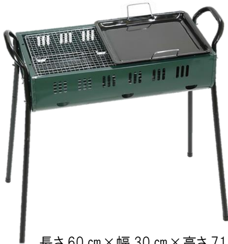
長さ 60 cm × 幅 30 cm × 高さ 71 cm

市民農園クラブハウス前の多目的広場にてご利用ください。 ウッドデッキ上では利用できません。