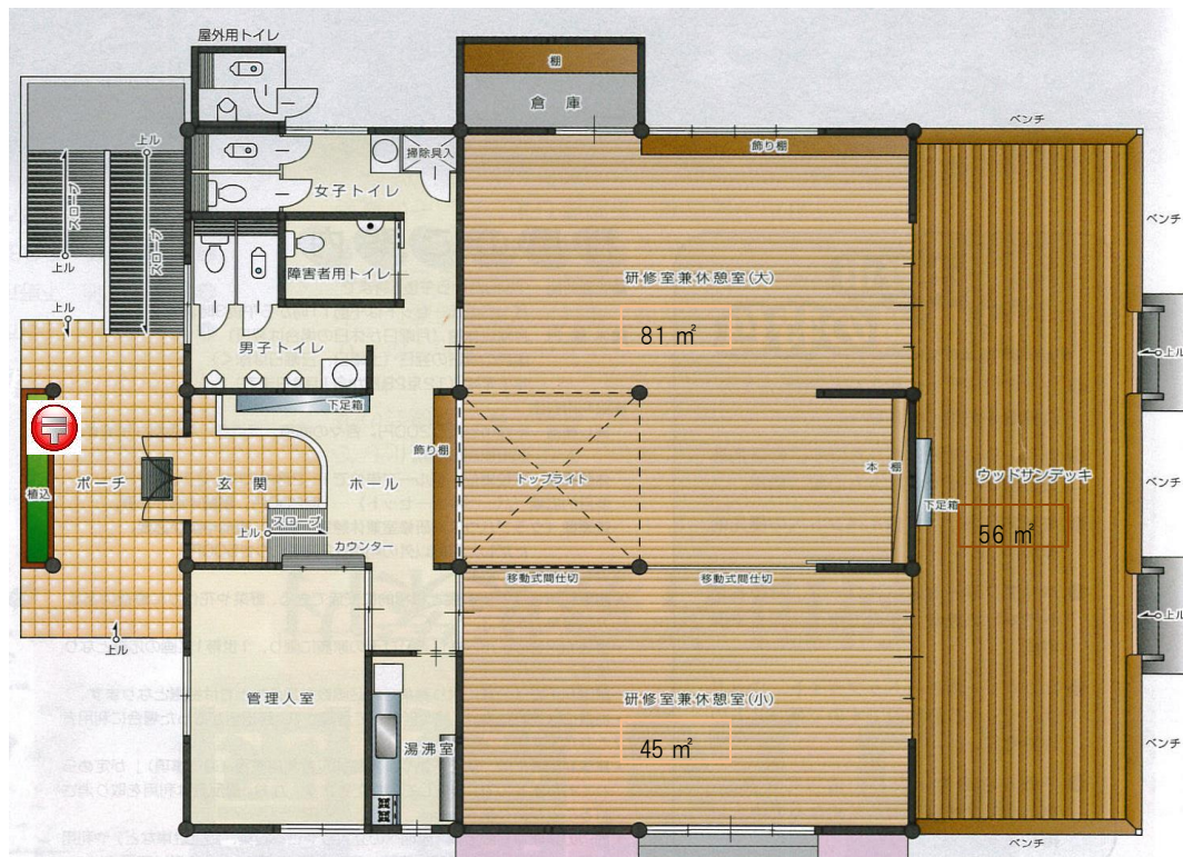
市民農園クラブハウス内平面図

(*1)電話で予約を取った後、利用日の5日前(休日に当たる日は除く)までに 市民農園施設利用申請書 をメール、FAXにて送信するか、下野市農業公社までお持ち下さい。申請書は、ホームページからもダウンロードできます。