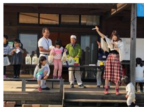
大抽選会「〇〇番大当たりおめでとう」