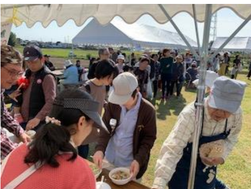
芋煮の前に長い行列ができました