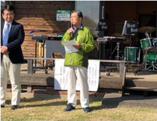
福島実行委員長の開会あいさつです

尚、実行委員会高德事務局長より農園まつりが盛大に開催された事に、お礼の言葉がありました。