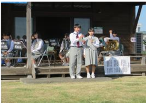
南河内中吹奏楽部のすばらしい演奏の始まりです