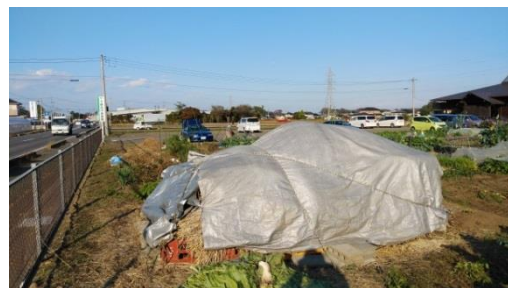
大量盗難後の状況