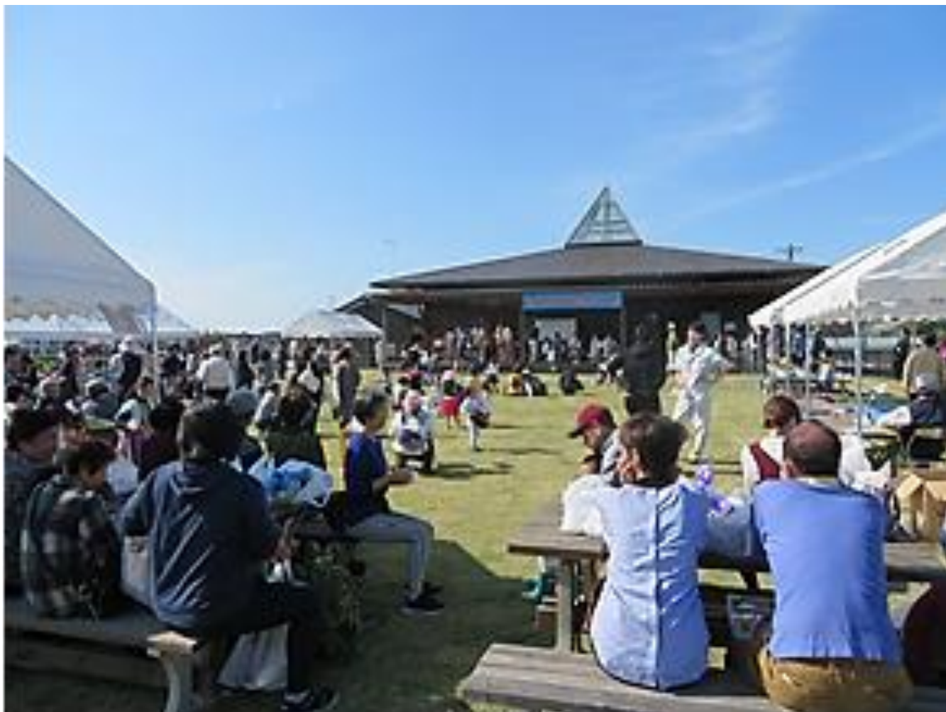
活気ある農園まつり全景です