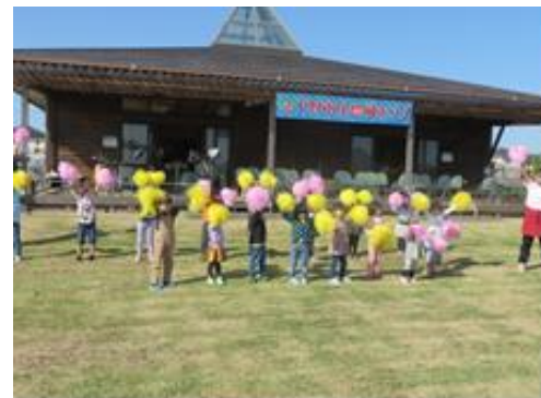
薬師寺保育園児のかわいいお遊戯です