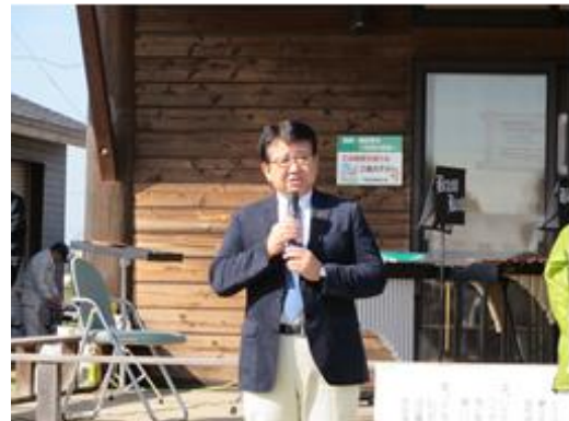
広瀬市長によるお祝いのあいさつです