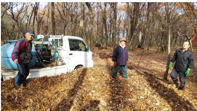
落ち葉の踏み固め