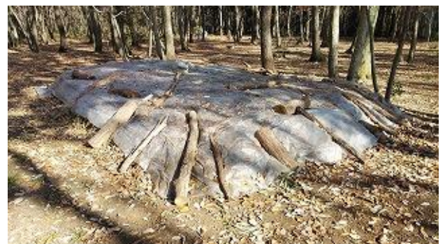
腐葉土床の出来上がり