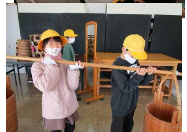
さくら市ミュージアム