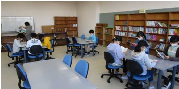
【新しい図書室 (旧パソコン室)】

本校の大規模改造工事もいよいよ終盤になってきました。校舎内は11月13日(土)と14日(日)の引越し作業により、体育館の一部とランチルームを除きほぼ元の位置に戻りました。2階の特別教室も整理整頓をしながら徐々に日常を取り戻しています。また、2階のパソコン室については、GIGAスクール構想として一人一台のタブレット端末が整備されたことに伴い、新しく図書室になります。また、これまでどおりオープンスペースや広い廊下にも本を置きます。本校の特徴である校舎の造りを生かして「いつでもどこでも学校まるごと図書館」になることをイメージしています。