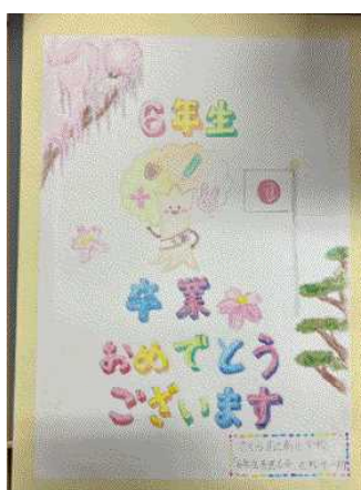
5年生 プレゼント入れ