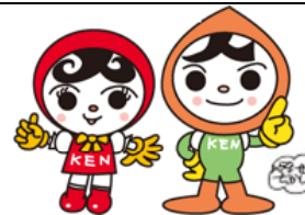
メインキャラクター