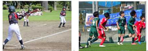
上松山小学校 体育文化後援会、上松山クラブ(野球・サッカー)