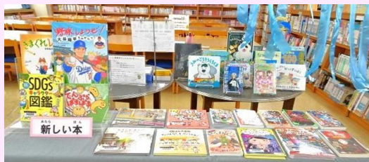
▲新しい本のコーナーです。