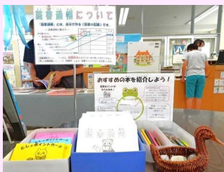
▲読書貯金通帳と おすすめの本を記入する ところです。