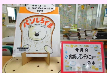
▲今月の 「おはなしランチメニュー」 の本です。