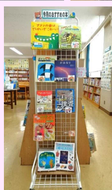
▲今月のおすすめの本