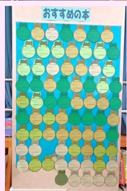
▲みんなのおすすめの本