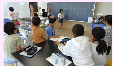
▲企画委員会でスローガンを決定