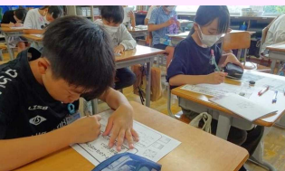
▲決まったスローガンに、自分の目標を記入します。