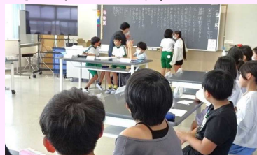
▲子ども会議でキーワードを発表