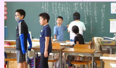
▲各学級でのキーワードの話し合い

本年度の「運動会スローガン」が決定しました。運動会スローガンは、子どもたちの想いが詰まった合言葉です。このスローガンの下、一丸となって全力を尽くします。(スローガンができるまで)