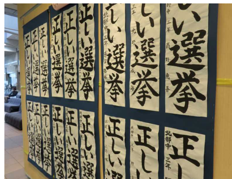
「明るい選挙書き初め展」市役所にて

また、市役所で開催された「明るい選挙書き初め展」では、22名の生徒が入選し、ふれあいギャラリーに展示されました。市役所を訪れた方も、みなさんの書に大変感動された様子でした。