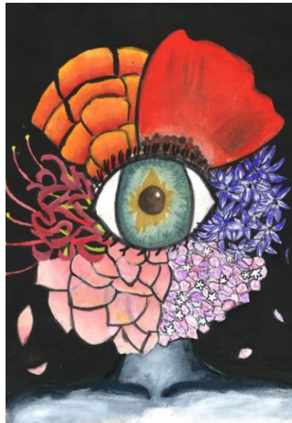
3-2 井上 澄利『感情のヨウセイ』