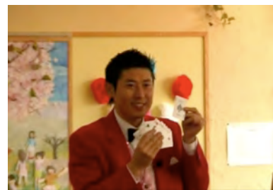
リクエストに応えマジックを披露