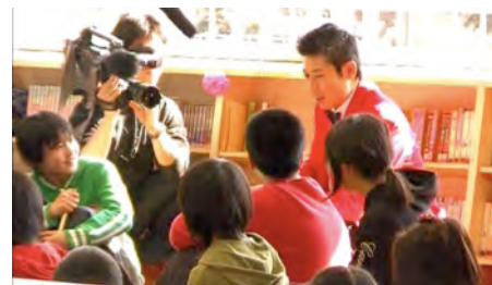
披露した感想を聞くマギー先生