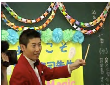
マジックの種明かし

子どもたちは、マギーさんから教えてもらったマジックをそのまま行うだけではなく、自分なりに工夫して、口上も考えて熱心に練習する姿がとても印象に残りました。