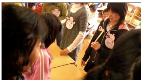
うまく披露できました!