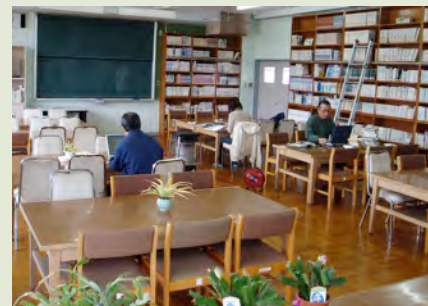
ボランティアの方も加わり、図書室整備が急ピッチで進んでいます