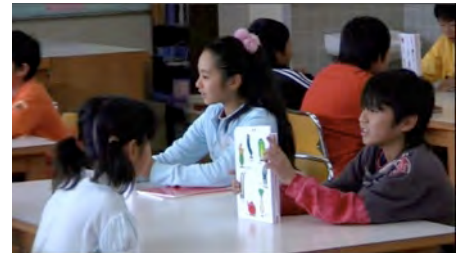
うまく披露できました！