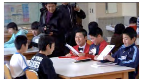
6年生が5年生にマジックを披露中！