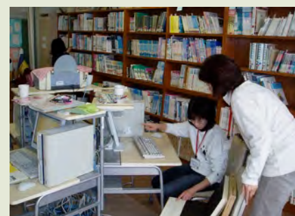
図書室でもインターネットが使えるようになりました。蔵書整理も終わり蔵書検索のためのデータベースもほぼ完成！