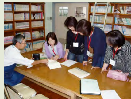
図書館司書の指導の下、図書室整備が 急ピッチで進んでいます