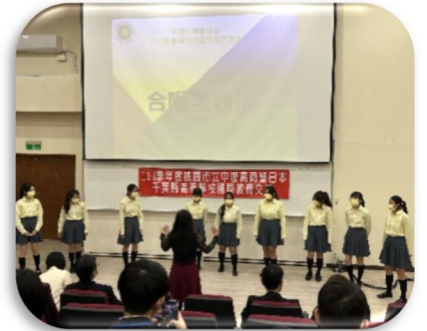
現地校の生徒が 歓迎の合唱を披露