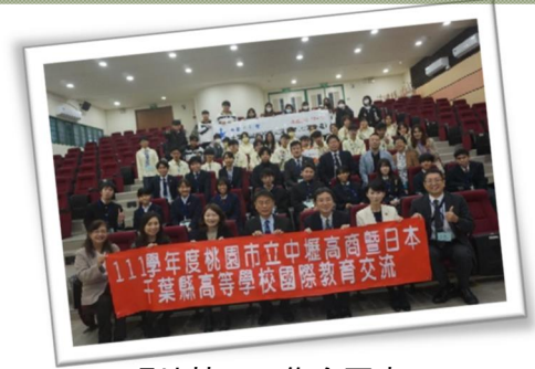
現地校での集合写真

（派遣校）県立千葉商業高校、県立東金商業高校、県立一宮商業高校、 県立君津商業高校、県立流山高校、県立成田西陵高校