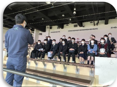
企業の日本人スタッフからの講話