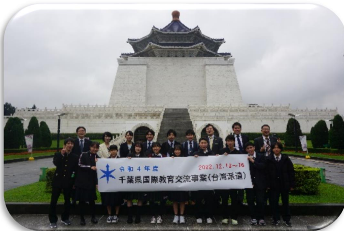
中正紀念堂での集合写真