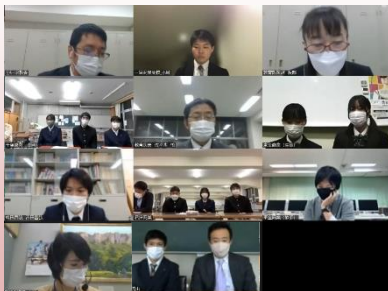
事前研修会 の様子