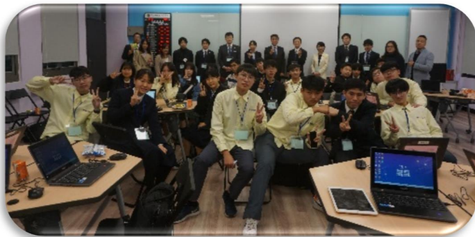
特別授業後に現地校での集合写真