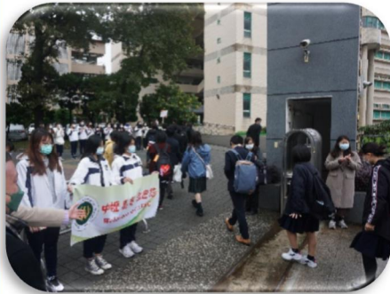
校門で出迎えを受ける