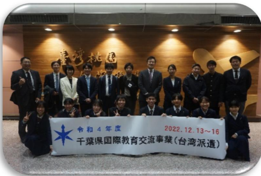
桃園国際空港に到着