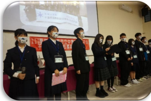
千葉県の生徒が 千葉県観光プランをプレゼン