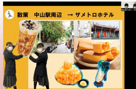
派遣校生徒による 台湾観光プランの 企画提案