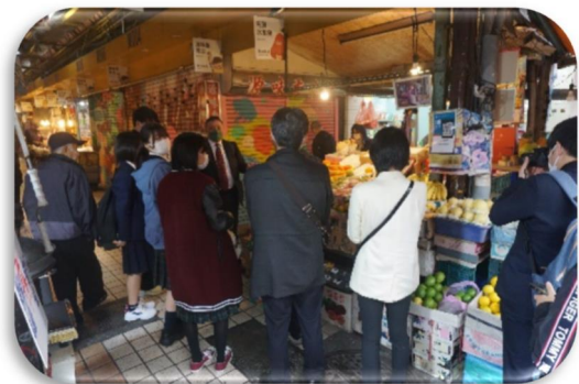
東三水街市場の視察