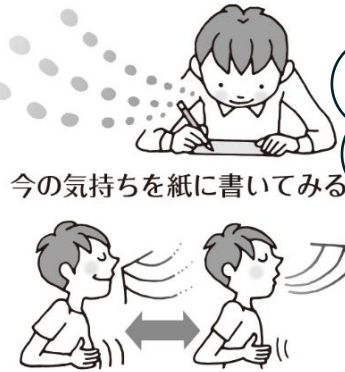
今の気持ちを紙に書いてみる