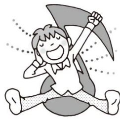
音楽を聞いたり歌ったりする