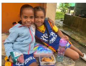
↑休み時間のおやつタイム