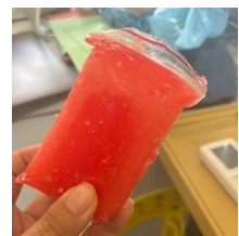
↑アイスキャンディー