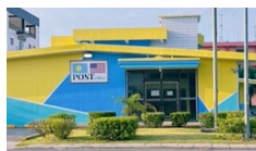
↑パラオ唯一の郵便局

皆さんは、自分の家の住所を知っていますか？実は、パラオには住所がありません！パラオで場所を説明する時は、「〇〇というお店の向かい側」「〇〇さんの家の右隣」のように言います。では、郵便物を受け取る時はどうしているのでしょうか。それは、パラオに1つしかない郵便局に全て届きます。この郵便局もコロールにあります。ここには、番号が貼られた小さな郵便箱がたくさんあり、パラオの人はみんな自分の箱を持っています。時々郵便局に行って自分の箱を確認し、郵便物を受け取っています。