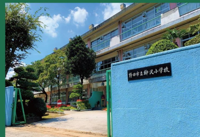
野田市立柳沢小学校