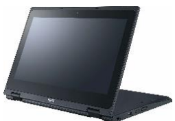
スタンドスタイル