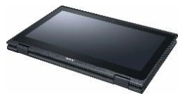
タブレットスタイル