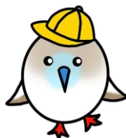
木間ヶ瀬小 キャラクター ビーすけ