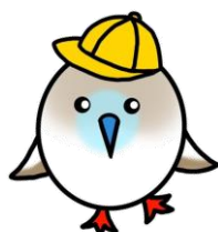
木間ヶ瀬小 キャラクター ピーすけ

今年度よりマチコミの登録を、更新作業なしで行えるようになりました。一度登録していただければ、そのまま卒業まで使うことができます。重要なお知らせの他、校外学習の途中経過や写真等も送っていますので、まだ登録されていないご家庭は早めの登録をお願いします。また、機種変更等により再度登録が必要になった場合は連絡帳等で担任までお知らせください。