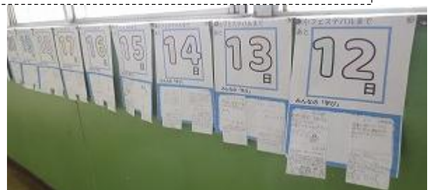
カウントダウンカレンダー 日にちの下に一人一人のコメントが添付されています 図書室前掲示