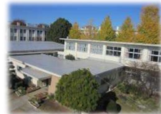
野田市立中央小学校