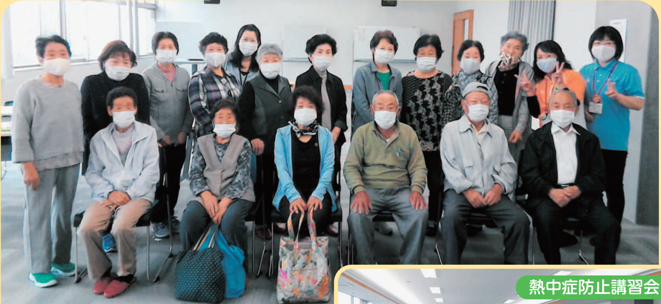
熱中症防止講習会