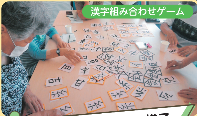
漢字組み合わせゲーム