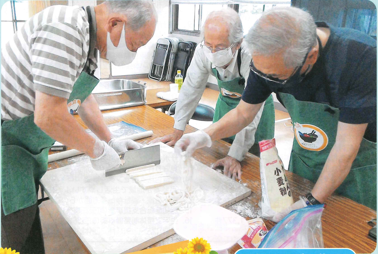
手打ちうどん作り♪