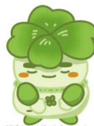
千葉県子どもと親のサポートセンター マスコットキャラクター こさぼん