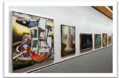
昨年度の県展の様子