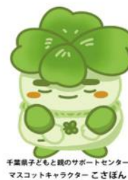
千葉県子どもと親のサポートセンター マスコットキャラクター こさぼん