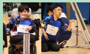
チームの司令塔の2人