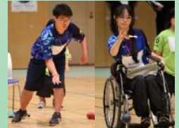
ねらいを定めた一球