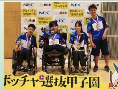
優勝を喜ぶ満面の笑みの選手たち