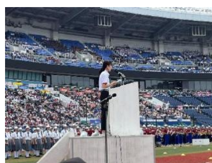
富塚教育長による激励