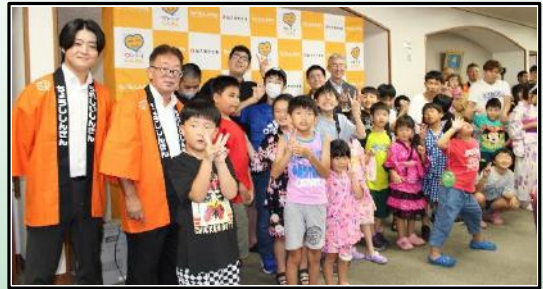
☆信金の方と写真撮影☆ 116名の参加

銚子市の夏の一大イベントである「銚子みなと祭り花火大会」が8月3日に開催されました。銚子信用金庫と銚子特別支援学校がタッグを組み計画した企画に、本校の児童生徒や御家族を招待し、本店8階ロビーから間近に花火を觀賞・体感しました。銚子信用金庫8階ロビーのウィンドウから眺める花火は臨場感にあふれ、子どもたちにとって夏休みの思い出の一日となりました。