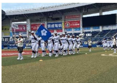
選手全員による一斉前進