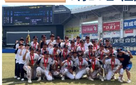
木更津総合高校 激闘を制し甲子園へ