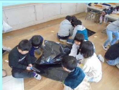
課題を再設定し、活動に取り組む様子