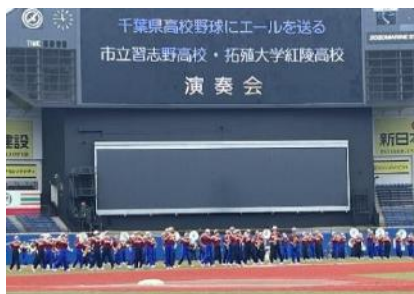
2校合同の演奏で選手にエール