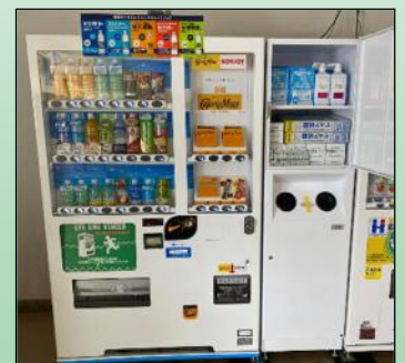
備蓄庫内(平常時、扉は施錠)