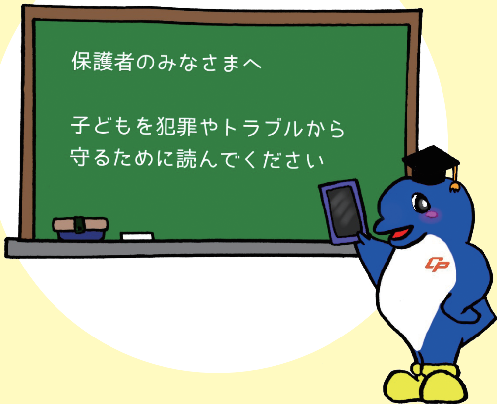
千葉県警察マスコットキャラクター 『シーポック』