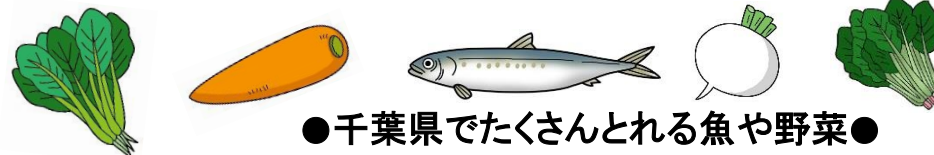
●千葉県でたくさんとれる魚や野菜●