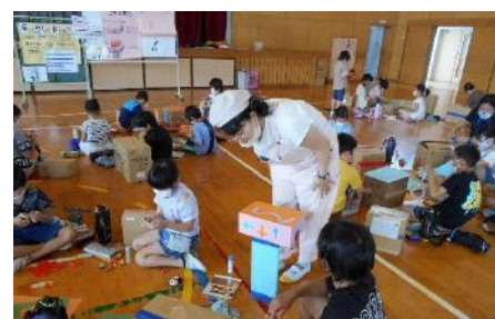
県内小学校でのキャリア教育の様子

また、キャリア教育については、昨年度実施した中高生や大学生等のキャリア意識調査の結果も踏まえて、県内11校の中学2年生を対象に、キャリアデザインの考え方などを学ぶモデル事業を新たに実施するなど、中学・高校の段階から、社会で働くことや様々な職業への関心を高め、将来への目標を持って広い視野で進路を選択できるよう取り組んでまいります。