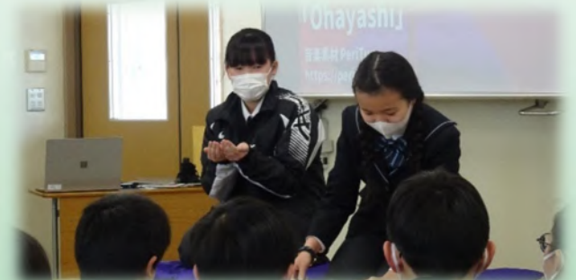
日本語の間(ま)を工夫して発表しました。

この日は英語の授業の一環として毎年行っている落語の対抗戦の準決勝が行われました。準決勝に残った9組は、自分たちで考えたジェスチャーを取り入れ、英語で落語の内容が伝わるように工夫をしていました。その成果もあり、対抗戦準決勝が行われた教室内は、絶えず笑いに包まれました。