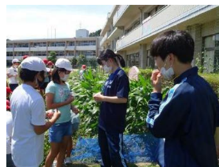
県立成東高校 小学校での実習の様子

県立高校と地元自治体や地域の小・中学校との連携により、高校と地域の双方の魅力向上が図れるよう、引き続き御協力をお願いいたします。