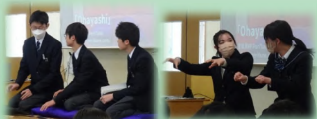
お互いの個性を認めながら切磋琢磨しています。