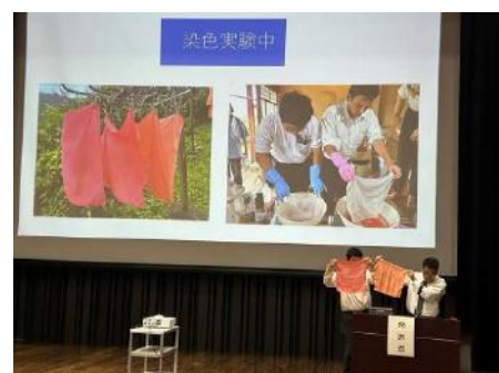
県立成田西陵高校 伝統的な染色法「茜染」の取組発表