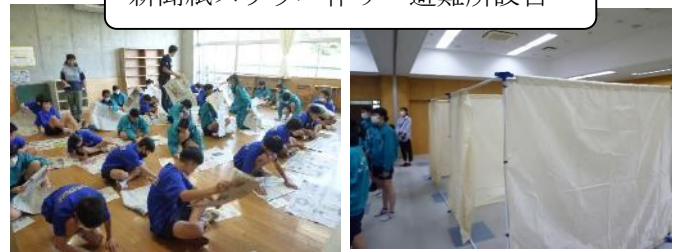
新聞紙スリッパ作り・避難所設営