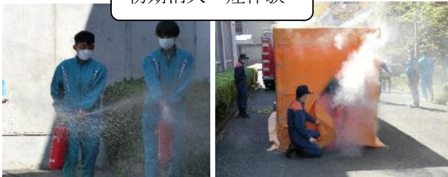
初期消火・煙体験