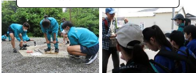
火起こし体験・町内フィールドワーク