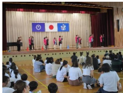
家庭教育学級（「東庄音頭」講習会）