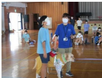
盲導犬協会出張講座