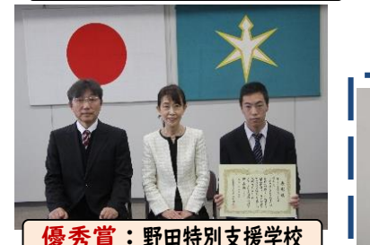
優秀賞：野田特別支援学校