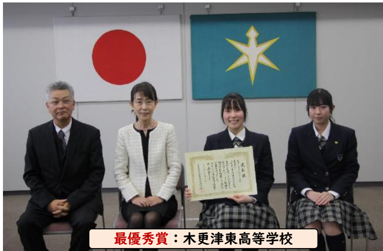
最優秀賞：木更津東高等学校

令和5年度は下記の7校が最優秀賞、特別賞、優秀賞をそれぞれ受賞し、2月6日（火）に表彰式が行われました。