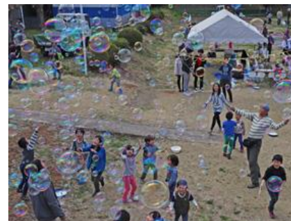
昨年の「ふれあい体験フェスティバル」の様子