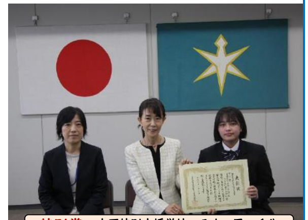
特別賞：市原特別支援学校つるまい風の丘分