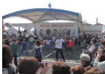
東庄町ふれあい祭