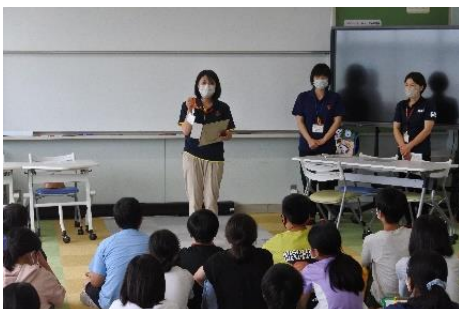
認知症サポート講座