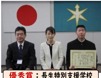
優秀賞：長生特別支援学校