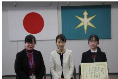
優秀賞：仁戸名特別支援学校