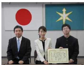
優秀賞：千葉工業高等学校