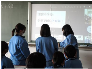
お互いの学校紹介