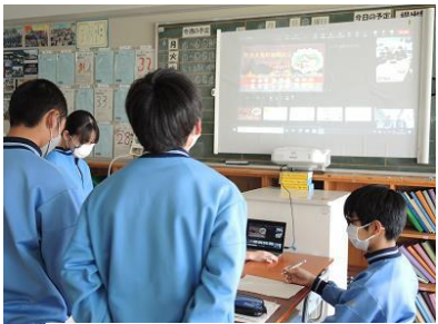
浦安中学校の発表を聞き、周防大島中学校生徒が感想を述べ、意見交流を行いました。