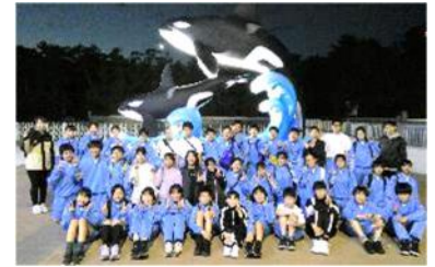
【オリエンテーション合宿】