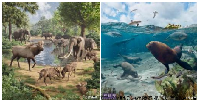
チバニアン期の海と陸を描いた景観復元画

当館職員が発見した世界最大級のトド「オオキトド」の化石や実物大復元画、ナウマンゾウの全身骨格など約 300 点の資料により、当時の房総の様子を鮮やかによみがえらせます。