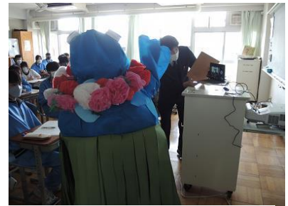
周防大島のキャラクターも登場