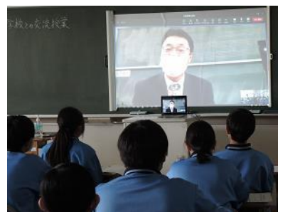
周防大島町役場の方から実際の施策についての説明

「郷土に対する想い」はどの地域でも共通していることを理解し、本校の生徒にとっても「ふるさとうらやす」の今や未来について考える貴重な機会となりました。