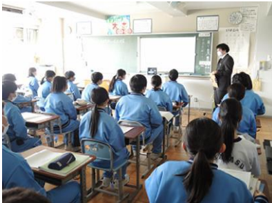
授業のねらいを確認

浦安市教育ビジョンの目指す子ども像の1つとして、「人や社会との積極的な関わりを通して、多様な人や文化に対する理解を深めること」があります。本校では、2年生の社会科の授業で取り扱った内容の発展的な学習として、中国・四国地方の過疎等の社会的課題を解決するための「地域おこし」についてアイデアをまとめ、オンラインで山口県周防大島町立周防大島中学校の生徒に発表を行いました。周防大島中学校の生徒からも感想がとどき、交流を通してお互いの地域についての理解を深めました。